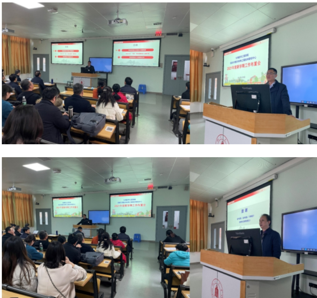
图 1 新学期开学工作布置会

在第二周正式开课前，提醒老师和同学再次核实个人课表，依照《四川大学2020-2021 学年春季学期本科教学工作方案》按时授课上课。对于疫情原因未能按时返校的学生，相关老师提前准备了相应的课堂教学方式，并及时联系因疫情原因未能按时返校的学生，进行远程授课事宜。